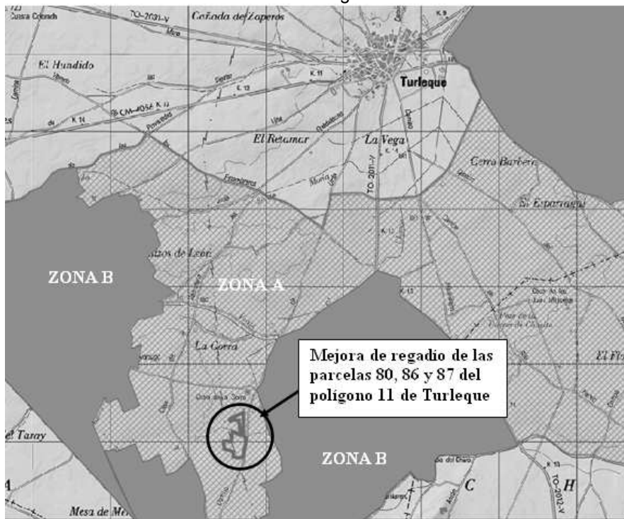
Plano de ubicación del proyecto de mejora de riego respecto al núcleo urbano de Turleque (Toledo)