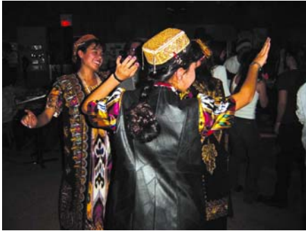
Photo : Durant la soirée culturelle : une danse de l'Asie centrale

Picture: Cultural evening: A dance from Central Asia