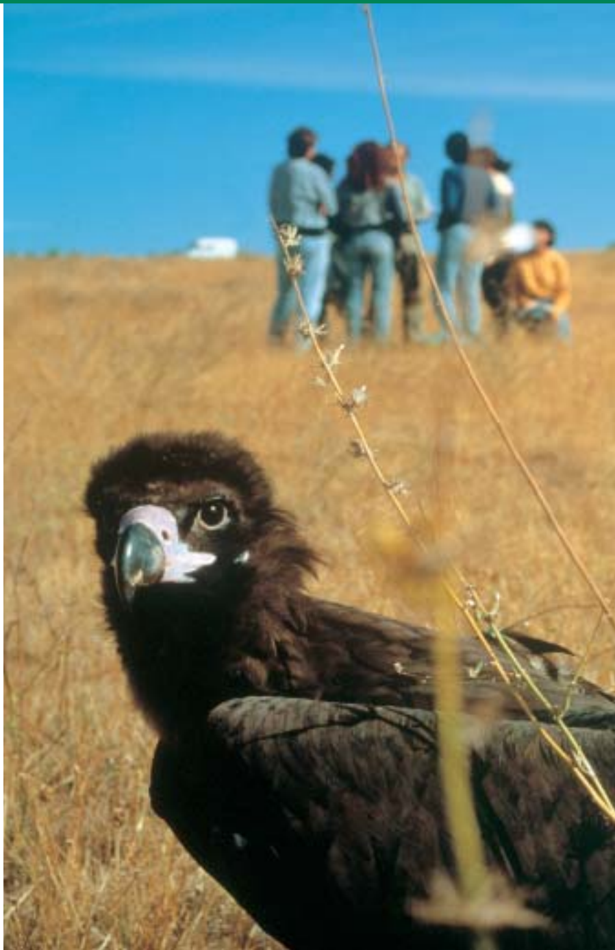
Algunos de los animales marcados proceden del Centro de Recuperación de la Fauna Salvaje de GREFA.

Un objetivo de esta iniciativa es que los comederos de la red se alternen para que los buitres no se acostumbren a ir siempre al mismo punto, y potenciar así su capacidad de realizar grandes desplazamientos para buscar alimento