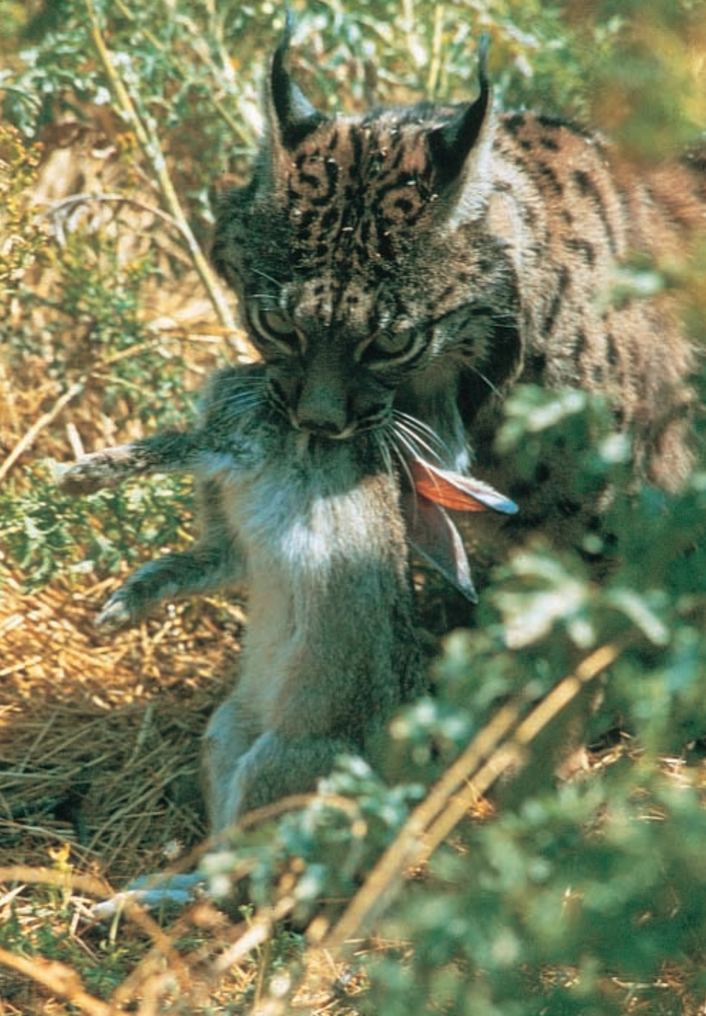
■ El conejo puede llegar a constituir el noventa por ciento de la dieta del lince.

También es destacable el acuerdo de Consejo de Ministros para financiar el Plan de Cría en Cautividad que se está desarrollando mediante un convenio con el zoológico de Jerez de la Frontera. Este Plan servirá de apoyo a todas las demás acciones e iniciativas que se están tomando para salvar al lince.