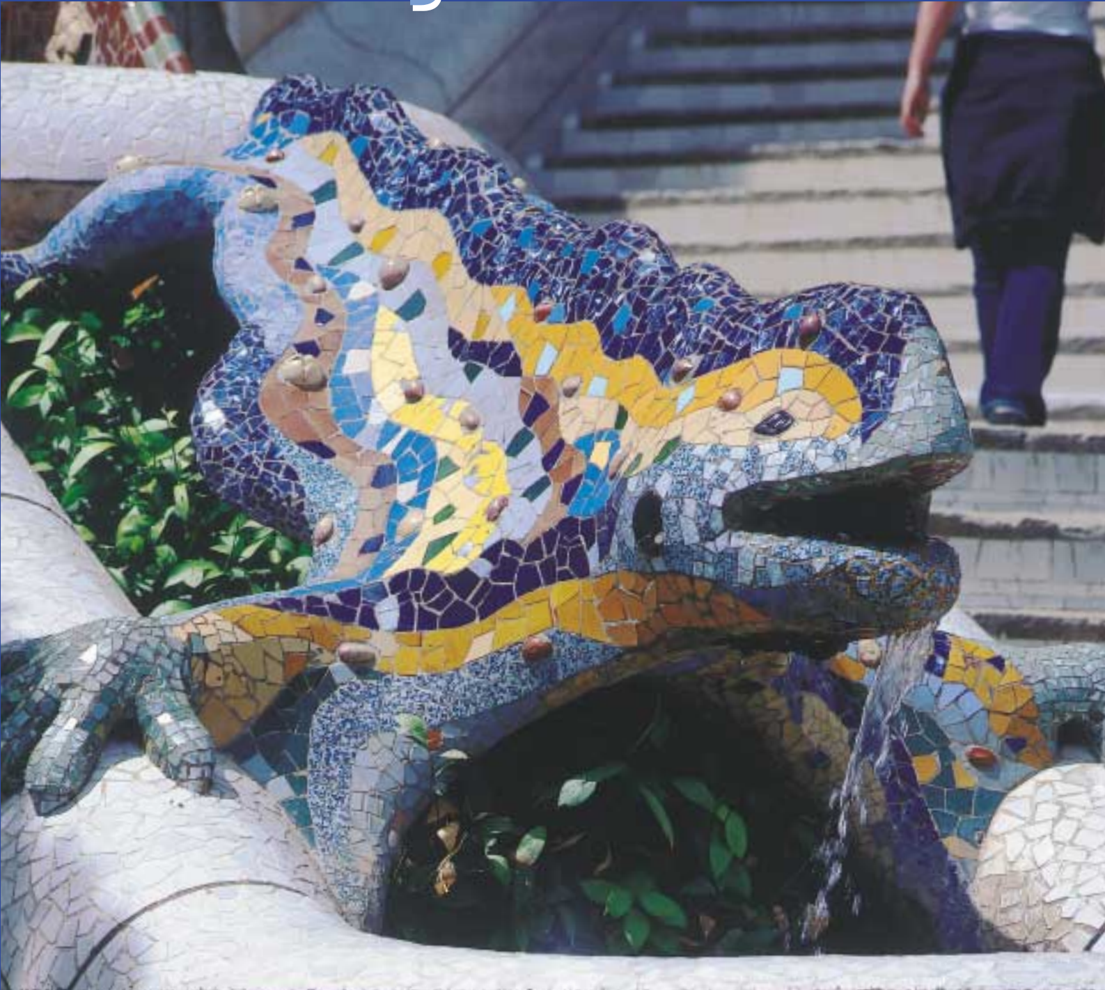
■ El dragón del Park Güell es el soporte de una fuente y representa al guardián de las aguas subterráneas. Foto: Xavier Gómez Roig. Cover.