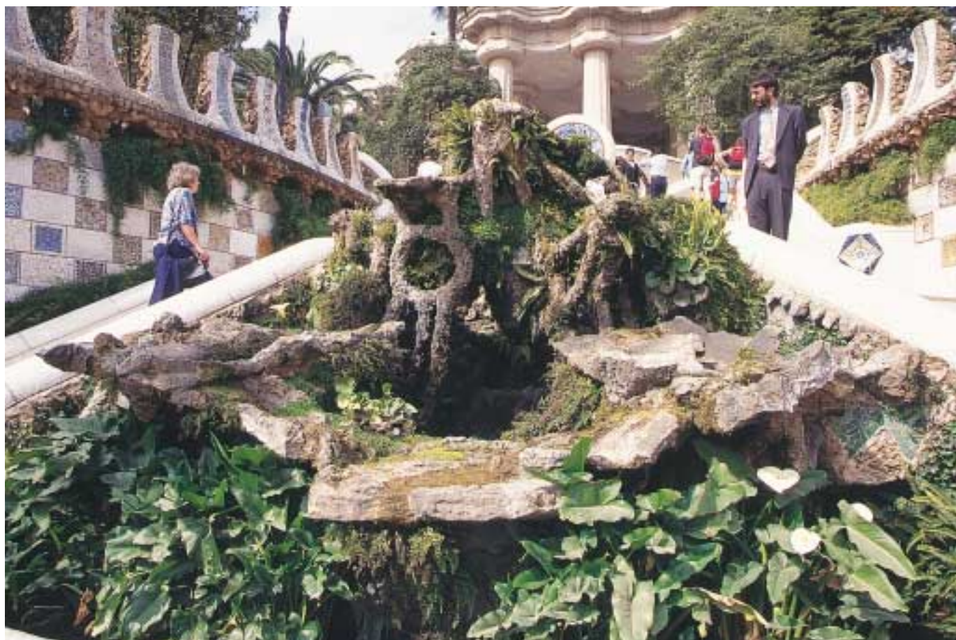
■ Pasear por el Park Güell y recorrer sus innumerables recovecos ayuda a penetrar en el mundo imaginativo de Gaudí.