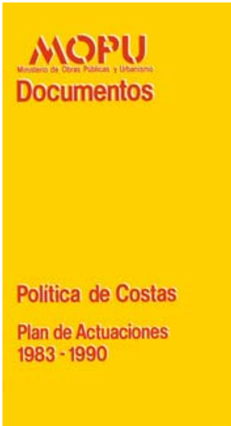
FIGURA 1. Portada del libro sobre la política de Costas de 1985, primer plan de actuaciones tras la democracia.