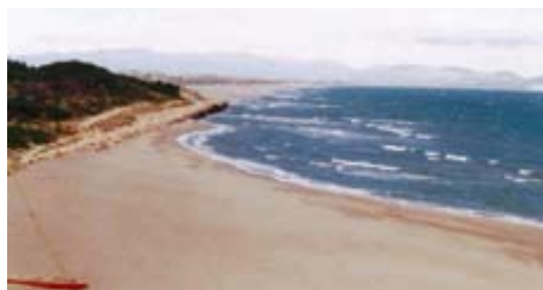
FIGURA 3. Playa del Riuet en la costa gerundense donde un muro separa la duna, competencia autonómica, de la playa, competencia estatal, cuyas consecuencias son evidentes.

Como vemos, el administrar la costa no es cosa de uno, sino más bien de todas las administraciones que deben considerar como suyos todos los problemas que en ella aparecen, exigiendo una cierta solidaridad y cariño. Las administraciones,