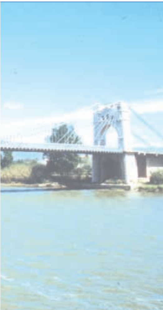
■ Río Ebro

nará como si el trasvase no existiera. Lo único que se va a hacer en su cuenca afecta a las presas ubicadas en el bajo Ebro —Mequinenza, Ribarroja y Flix—, unas presas que, en estos momentos, tienen un uso exclusivamente hidroeléctrico. En el futuro, lo que se hará con ellas será utilizarlas también para objetivos medioambientales y para regular el trasvase, es decir, se va a posibilitar su aprovechamiento para la transferencia del agua sobrante. Es la excepción. En el resto de la cuenca no se hará nada”, dicen las mismas fuentes.