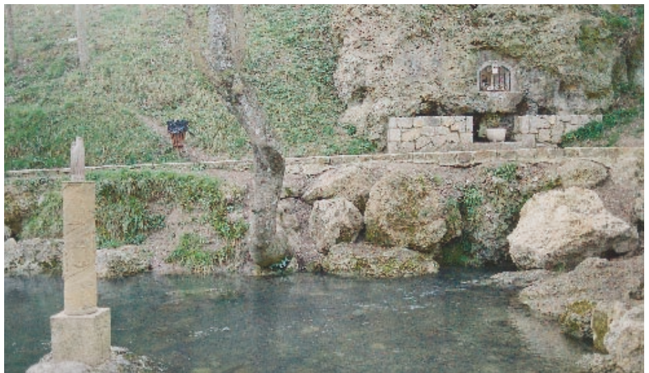
Nacimiento del río Ebro en Fontibre (Cantabria).

Las nuevas Demarcaciones Hidrográficas contempladas por la Comisión Europea tienen mucho en común con las Confederaciones Hidrográficas.