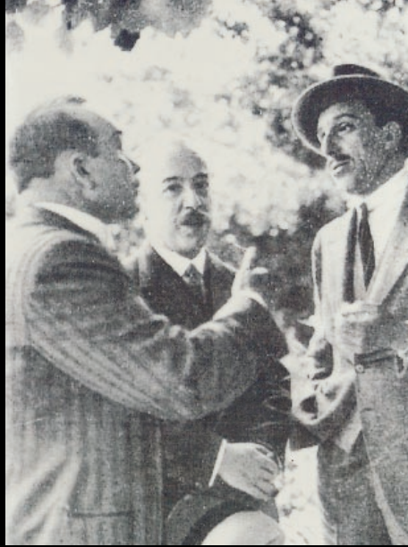
El rey Alfonso XIII con Manuel Lorenzo Pardo en el Canal de Urgel en 1930.

La Ley de Aguas de 1985 establece los principios generales de la Administración pública del agua: unidad de gestión, tratamiento integral, economía del agua, desconcentración, descentralización y participación de los usuarios- Se establece también el respeto a la unidad de cuenca hidrográfica y la conservación y protección del medio ambiente. Otros puntos contemplados en la misma son el respeto al ciclo hidrológico y la planificación con los Planes Hidrológicos de cuenca y el Plan Hidrológico Nacional.