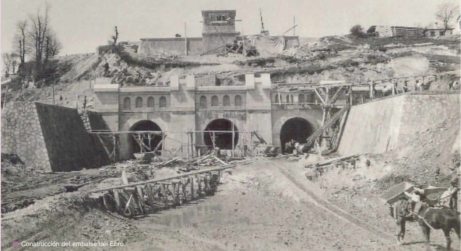
■ Construcción del embalse del Ebro.

Texto: Eloísa Colmenar