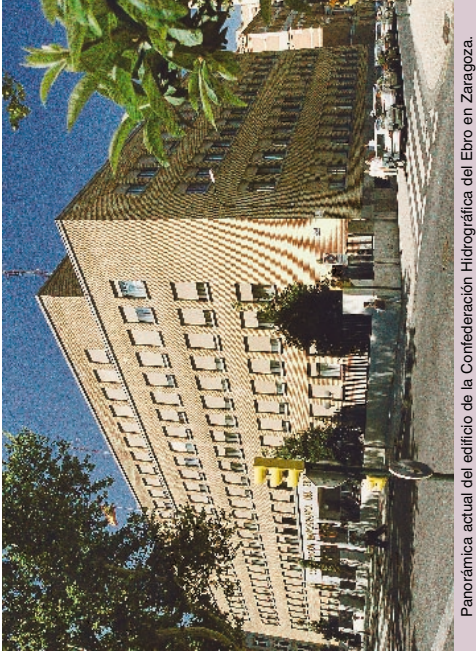
Panorámica actual del edificio de la Confederación Hidrográfica del Ebro en Zaragoza.