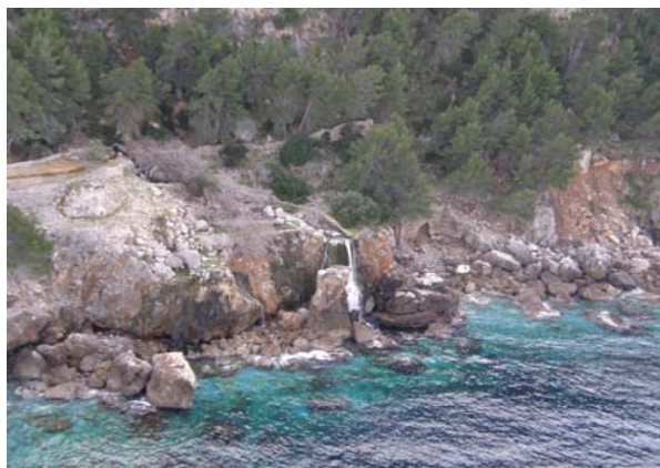
Manantial de Sa Costera (Mallorca)